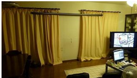
②スクリーンを降ろします