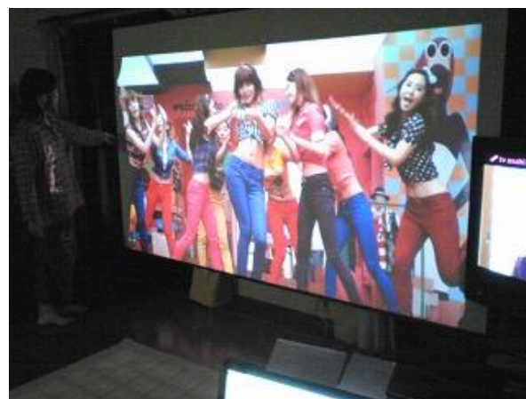
⑤等身大なのでステージに上がったみたい