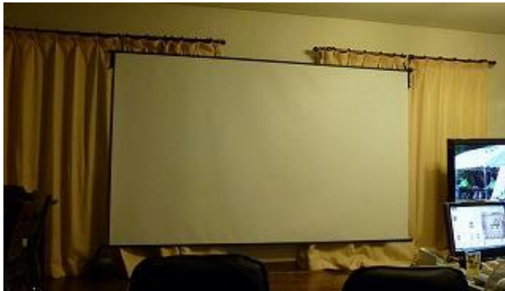
③ホームシアターの完成 1stスクリーン ガラスビーズ120インチ(MB-120W)