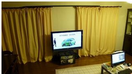
①プラズマTVを脇へ移動 (Wooo46インチ)